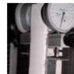
Classi di crack bridging statico