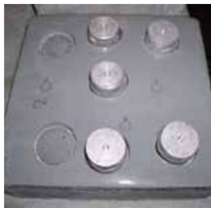
Test di resistenza all'urto

Resistenza all'abrasione: si tratta della capacità di un rivestimento, in adesione al supporto, di resistere all'azione abrasiva di una mola di caratteristiche note UNI EN ISO 5470-1. La valutazione della performance si effettua attraverso la misurazione della perdita di peso